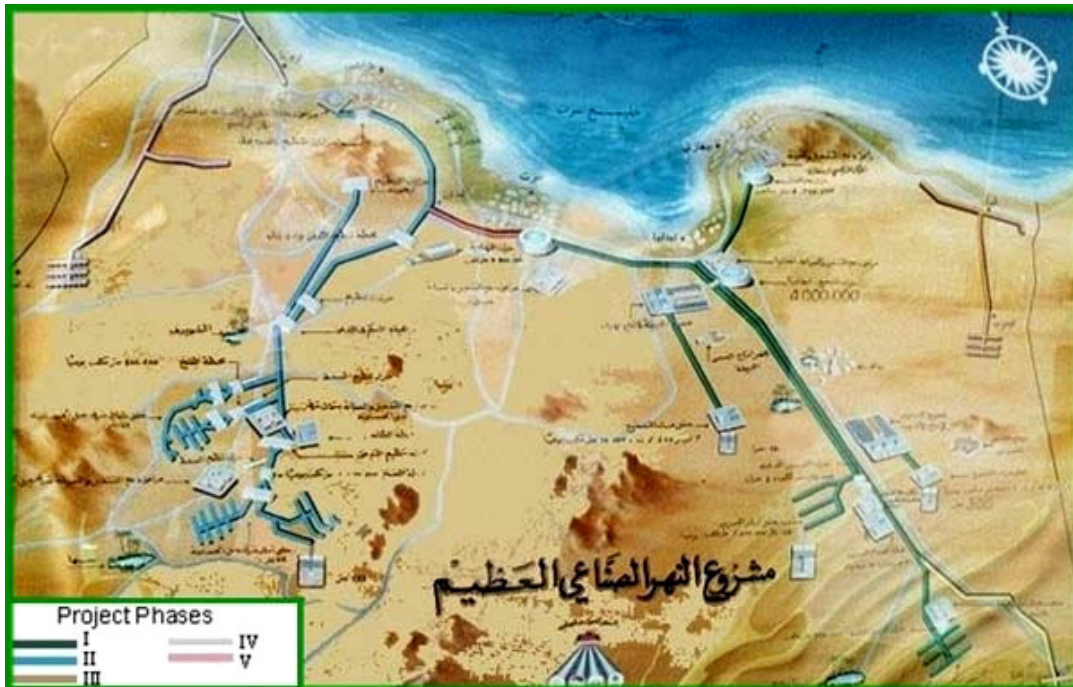
Das achte Weltwunder - Libyens Wasserprojekt

Dabei ist klar, worum es dort geht. Ziel ist, ein Land in die Knie zu zwingen, das einen eigenständigen Weg gehen will, sich der hemmungslosen Gier des großen Kapitals in den Weg stellt und seine Bodenschätze nicht bedingungslos ausbeuten lassen will. Dazu gehören Öl, Gas und - nicht zu vergessen - Wasser.