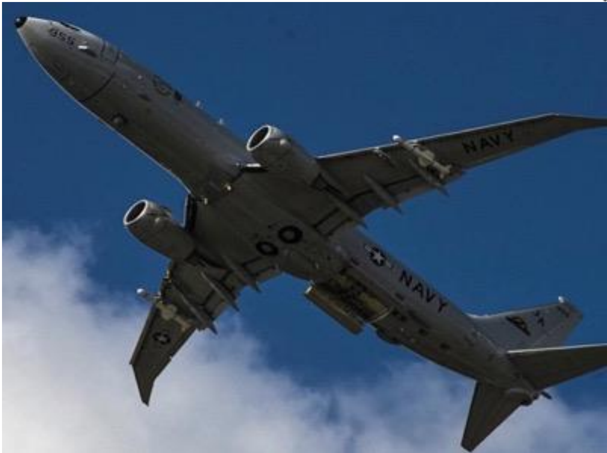
Ein US-Spähflugzeug, aufgenommen während eines Aufklärungsfluges in der Nähe der Straße von Kertsch

Die internationalen Medien haben über den Zwischenfall in der Straße von Kertsch schlecht informiert, indem sie versucht haben den Anschein zu erwecken, dass es sich um eine Einschränkung des freien internationalen Schiffsverkehrs durch Russland